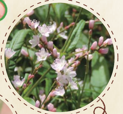
サクラタテ タコノアシ